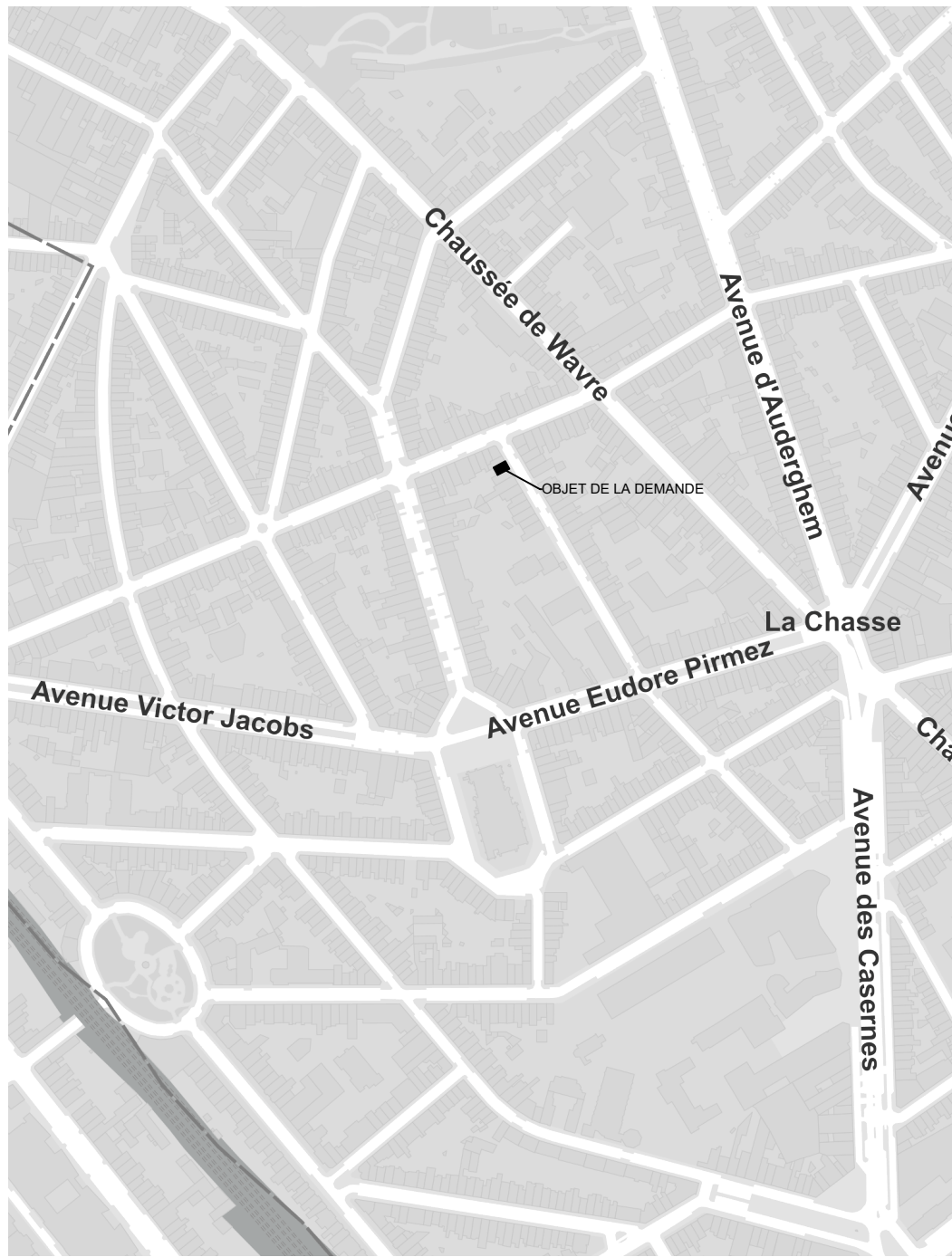
Plan de Localisation 1/5000